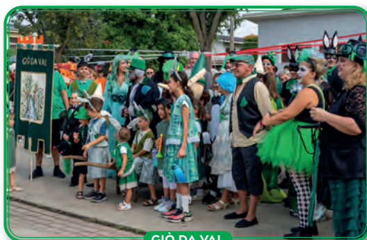
GIÒ DA VAL