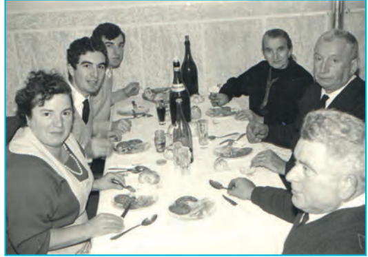
Pranzo di Natale - circa 1964

Abbiamo raccolto alcune brevi narrazioni; quest'anno desideriamo augurare un felice Natale con le parole di alcuni nostri anziani Gerenzanesi.