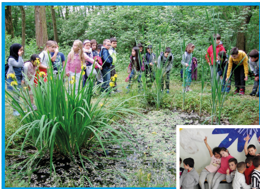
Alunni in visita allo stagno didattico presso il fontanile di San Giacomo

Durante i laboratori artistici gli alunni hanno utilizzato carta, forbici, colla, pennarelli e altri materiali per riprodurre la natura partendo da immagini di Land Art: grandi fiori fuori scala, paesaggi d'acqua, architetture naturali e vere e proprie opere d'arte create con materiale riciclato, che sono state messe in mostra con orgoglio nei corridoi delle scuole e nell'aula didattica del Parco degli Aironi.